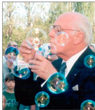
President Lennart Meri AHHA esimesel näitusel 1998.

Teaduskohvik on Briti Nõukogu ja teaduskeskuse AHHA uus sariüritus, kus vabas õhkkonnas teadusteemasid arutatakse.