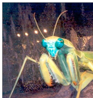
Putukaeksemplar Londonist.